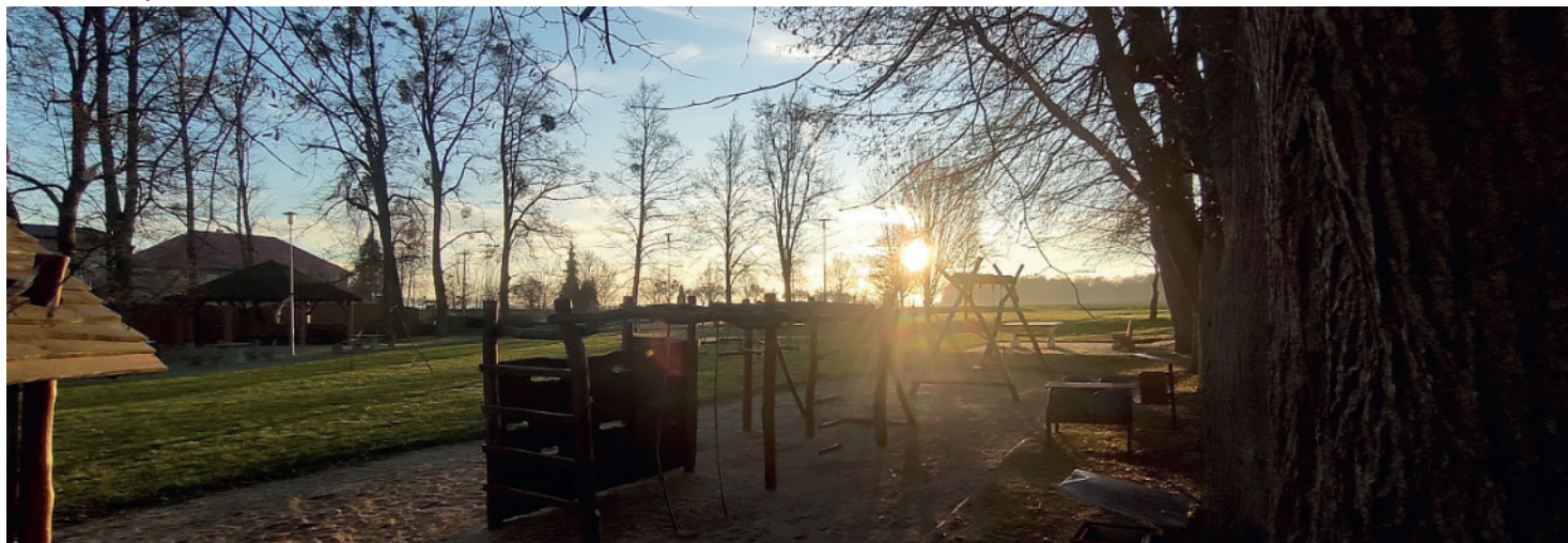
Hřiště za kulturním domem. Leden 2023 +11°C.

Vstoupili jsme do nového roku 2023, který nebude rokem jednoduchým s ohledem na válečný konflikt na Ukrajině a energetickou krizi. Budeme doufat, že se vše brzy vyřeší a ke konci roku budou optimističtější vyhlídky. Chtěla bych poděkovat všem občanům, spolkům a dalším, kteří přispěli k vytvoření vánoční atmosféry v obci, ať to byly vánoční výstavy, vánoční dílny a tvoření, adventní koncert v kostele, betlémské světlo, školce a škole za přání pro seniory. Snad jste si vánoční svátky užili v pohodě a klidu a do nového roku vstoupili s odhodláním, optimismem a úsměvem, s kterým jde všechno líp.